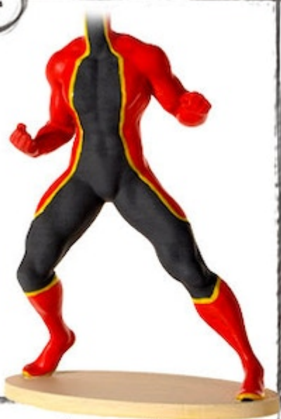
final 3D Prototype