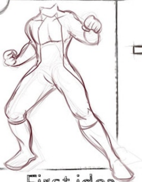
First idea /sketch